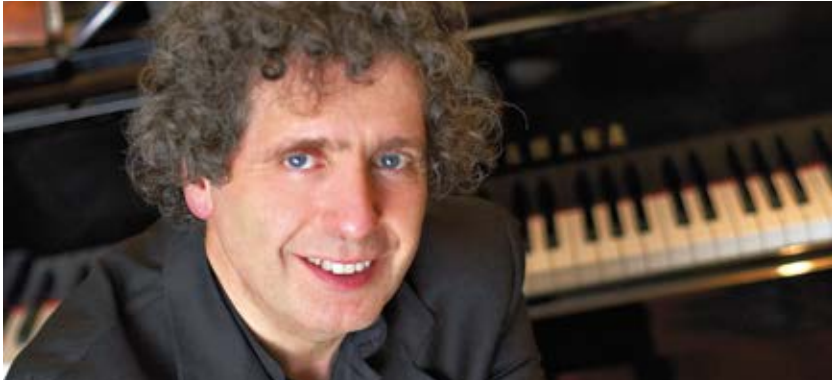
Michaël Levinas