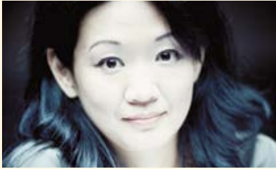
Momo Kodama