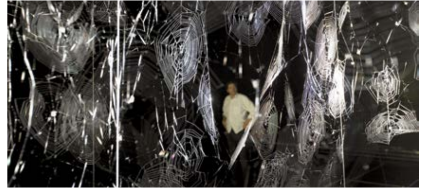
Tomás Saraceno, How to Entangle the Universe in a Spider Web