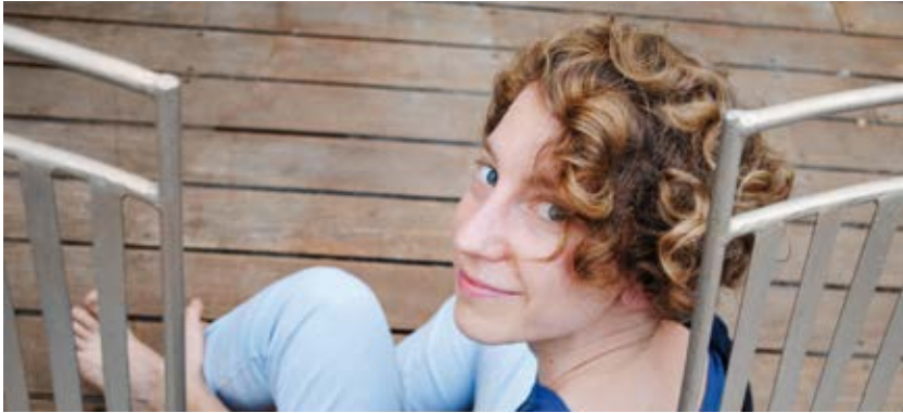
Sivan Eldar

Dans le cadre du Festival de Royaumont 2018