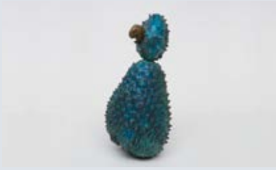
Galapagos, 2007. Bronze et acrylique. Photo : Eduardo Ortga © Erika Verzutti

DU MERCREDI 20 FÉVRIER AU LUNDI 15 AVRIL GALERIE 3