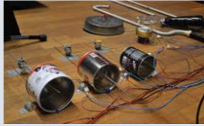
Regnum Lapideum © Andrea Valle

Entrée avec le billet « Musée et Expositions » du Centre Pompidou.