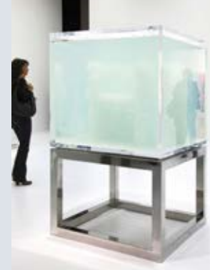
Venus, Natural Crystal Chair © Tokujin Yoshioka