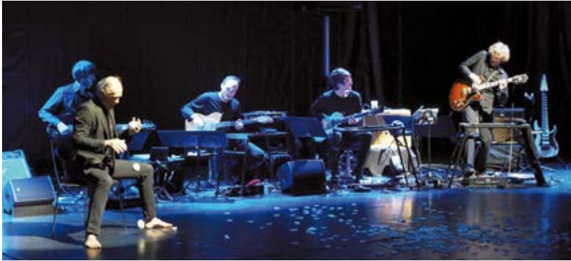
Première de Six White Dots d'Henry Fourès dans le cadre du « Einweihungsfestival » le 2 décembre 2017

Dans le cadre du festival Mesure pour Mesure